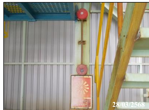
ภาพที่ 15 ตู้เก็บอุปกรณ์ป้องกันอันตรายส่วนบุคคล