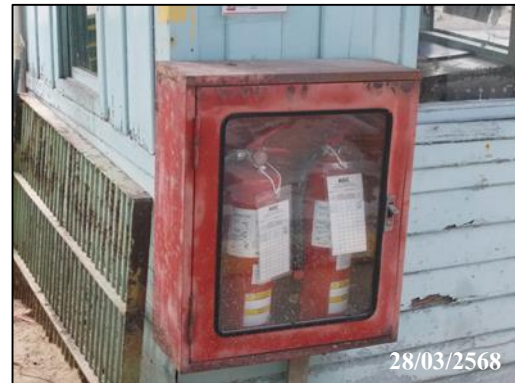
ภาพที่ 17 การจัดเตรียมถังดับเพลิง บริเวณท่าเทียบเรือ